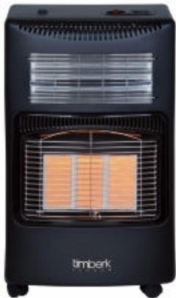
На рисунке: модель TGH 4200 M2