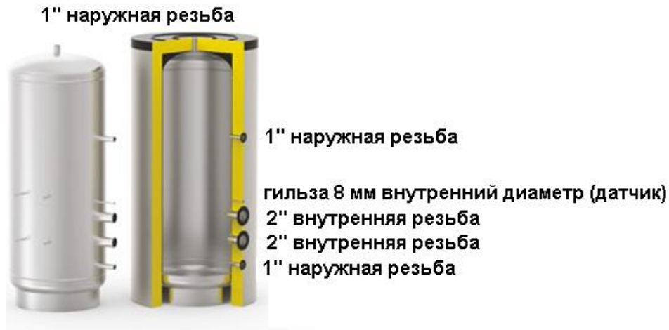
Схема бака серии SS ELECTRO