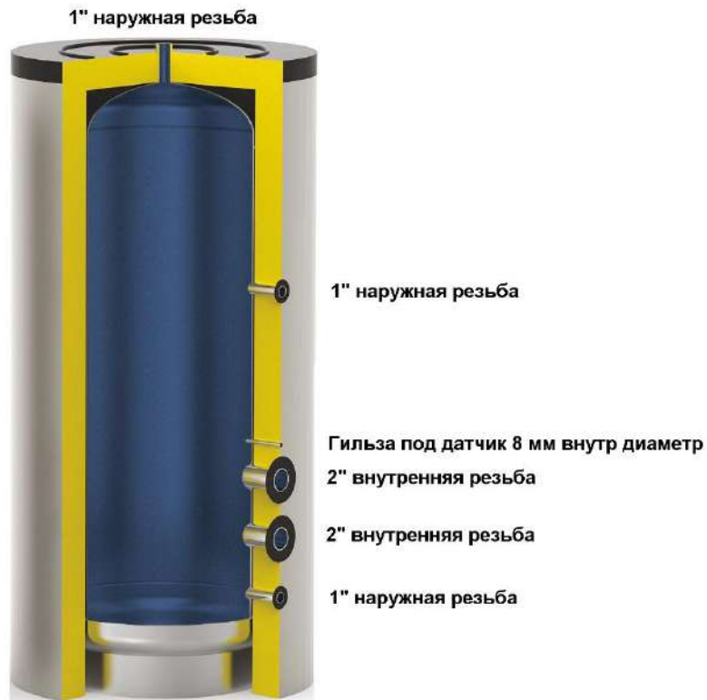
Схема бака серии АТР ELECTRO ЭМАЛЬ